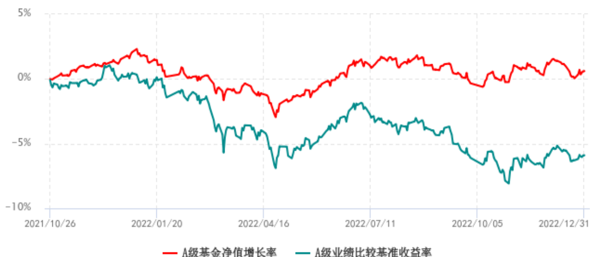
A级基金份额累计净值增长率与同期业绩比较基准收益率历史走势对比图 (2021年10月26日-2022年12月31日)